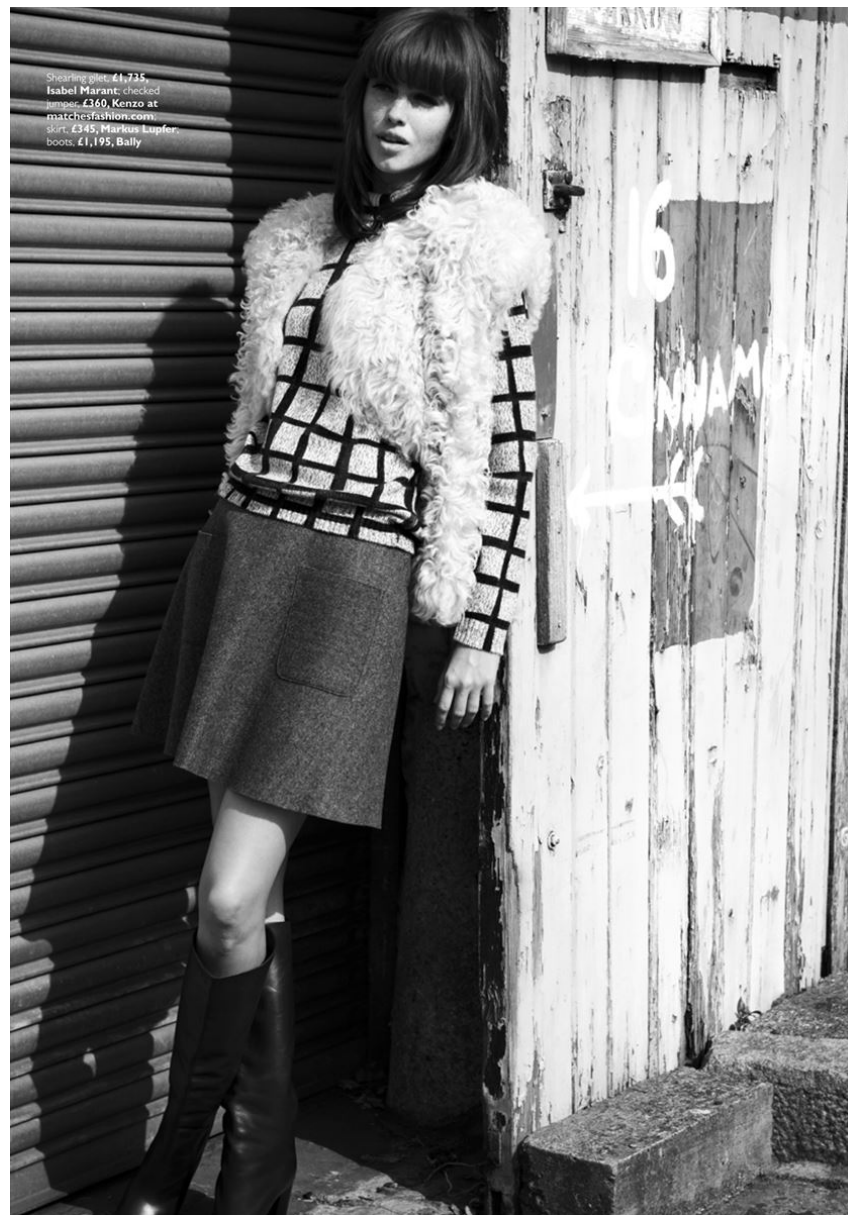
Shearling jacket, £1,735, Isabel Marant; checked jumper, £360, Kenzo at matchesfashion.com; skirt, £345, Marlene Kupfer; boots, £1,195, Bally