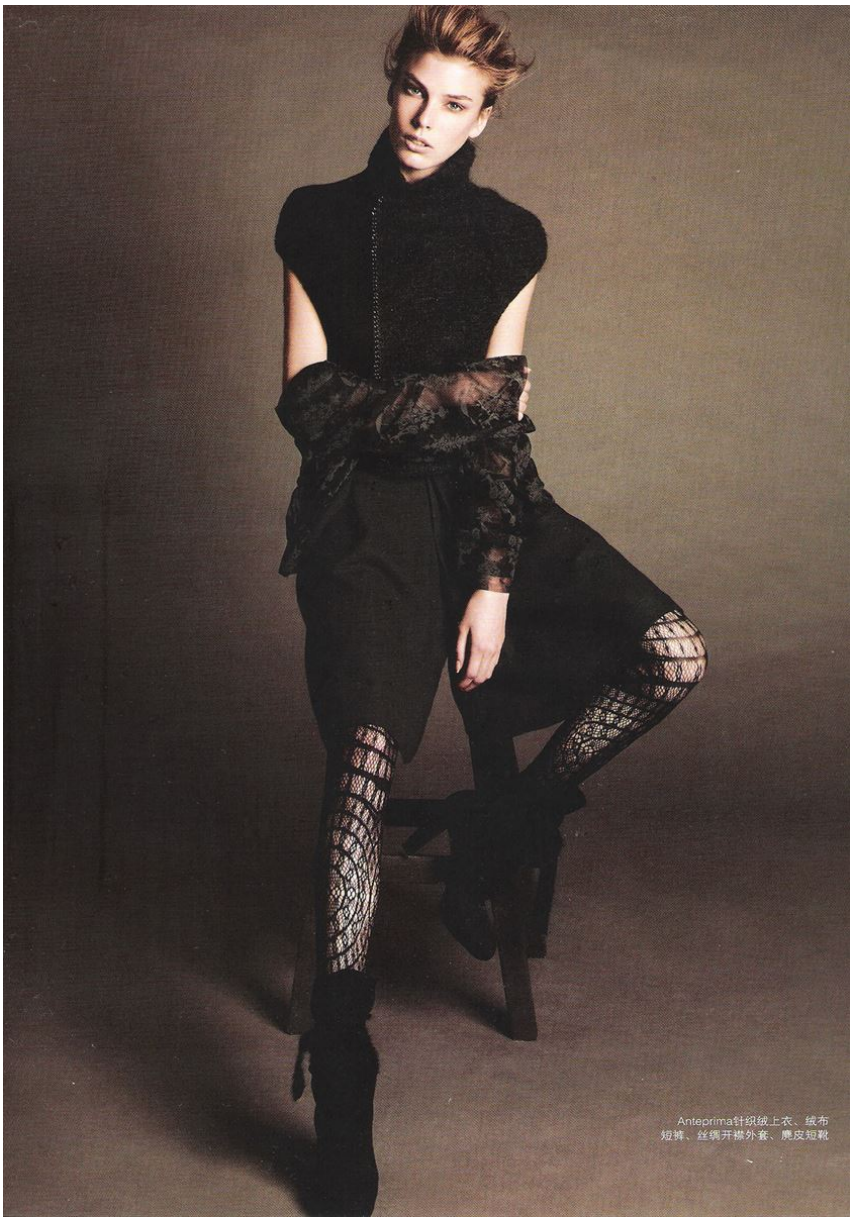
Anteprima 针织上衣、绒布短靴、丝绸开襟外套、鹿皮短靴