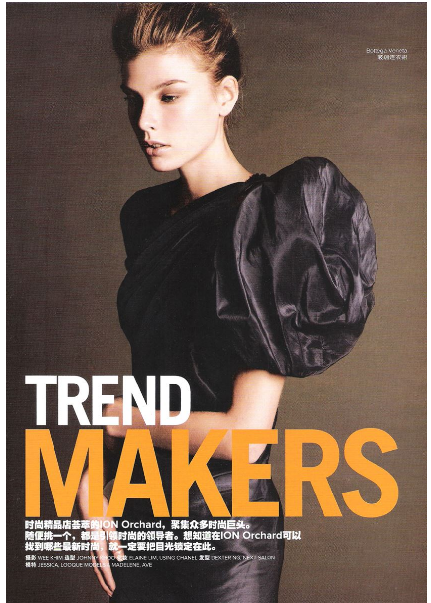
Bottega Veneta 皱褶连衣裙